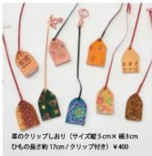
革のクリップしおり (サイズ縦5cm×横3cm ひもの長さ約17cm/クリップ付き) ¥400

コンコンコン、木槌で革に刻印する音が響きます。 ジュワッと焼印を付ける時の革を焼く匂いがします。 刻印で模様を打ったり電気ペンで絵を描いたり、 その日の気分でまったく違った物が出来上がります。