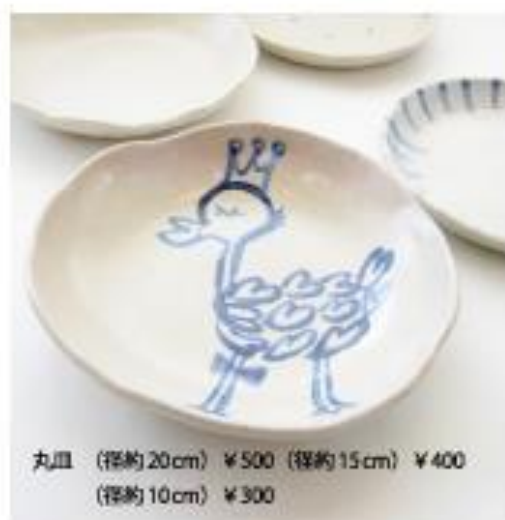
丸皿 (径約20cm) ¥500 (径約15cm) ¥400 (径約10cm) ¥300