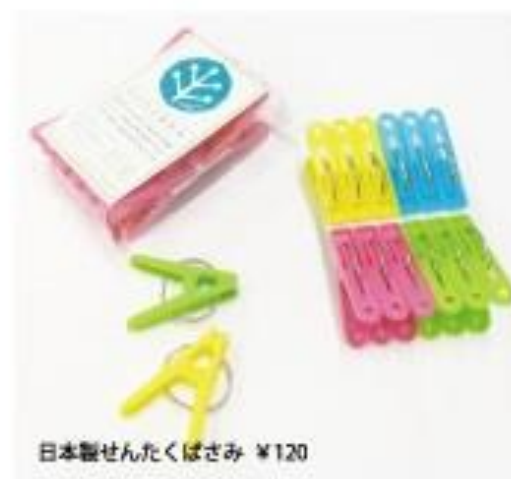
日本製せんたくばさみ ¥120

材料はすべて日本製。 毎日こつこつ丁寧にしっかりと、せんたくばさみを組み立てています。品質は丈夫で長持ち。心のもった手作りのせんたくばさみをぜひ使ってみてください。