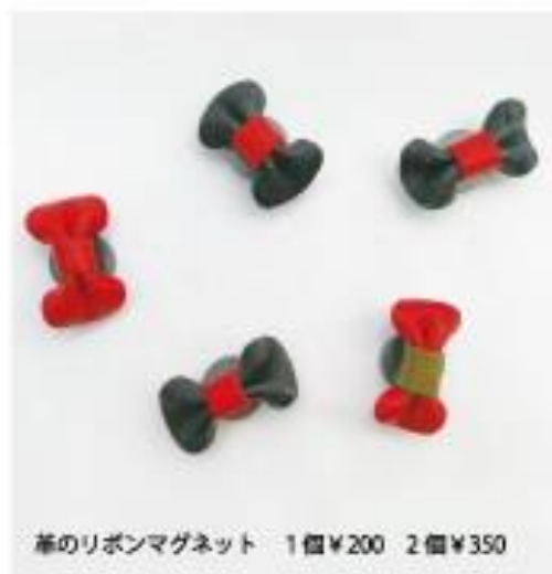
革のリボンマグネット 1個 ¥200 2個 ¥350