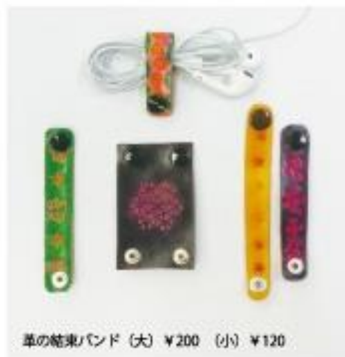
革の結束バンド (大) ¥200 (小) ¥120