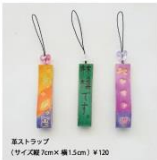
革ストラップ (サイズ縦7cm×横1.5cm) ¥120