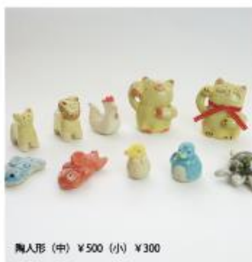
陶人形 (中) ¥500 (小) ¥300

知る人ぞ知る「浜竜釜」は、友愛のさとの敷地の裏手にあり、 なかなか皆さんの目に触れることはありませんが、 20年以上の間ずっとはばたきの陶芸製品の焼成を担ってきました。 利用者さんが一つひとつ丁寧に手作りした器や陶人形を お客様に伝えるという大事な仕事を「浜竜釜」は続けています。